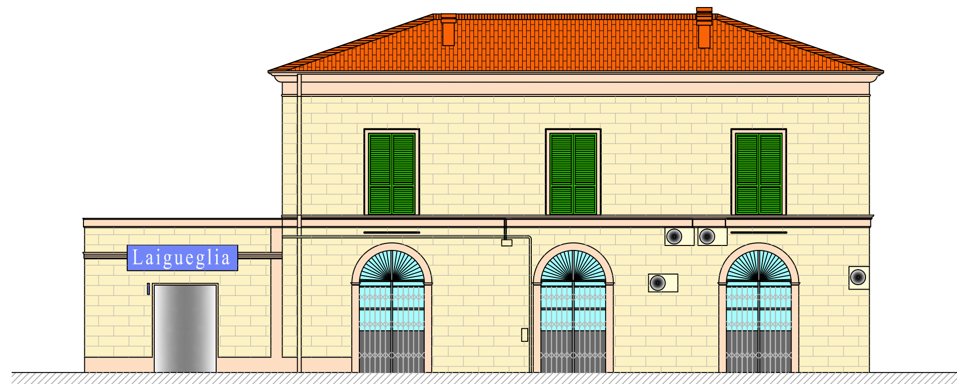
PROSPETTO C Scala 1:100