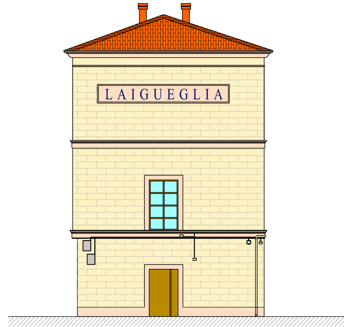
PROSPETTO B Scala 1:100